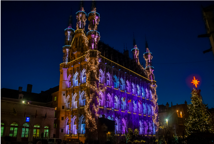
Sfeerbeeld van Winterrijd 2019 te Leuven

Uiteraard zijn attracties, zelfs een ijspiste, vaak betalend. Lichtspektakels daarentegen zijn vaak kosteloos te bezichtigen. We willen immers wat geld overhouden om te spenderen op de kerstmarkt zelf, niet?